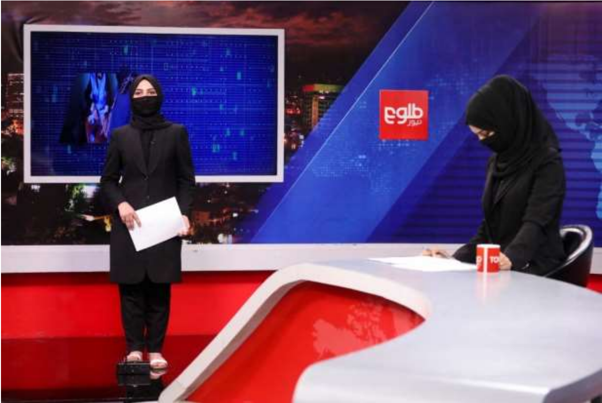
د آرشيو انځور، د طلوع نیوز د خبر سټیډیو، کابل.