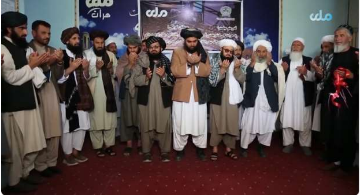
په هرات ولايت كې د شريعت غږ راډيو د فعاليت پرانيسته. د انځور سرچينه: ملي راډيو او ټلويزيون، ۲۰۲۴ د اپريل ۱۶