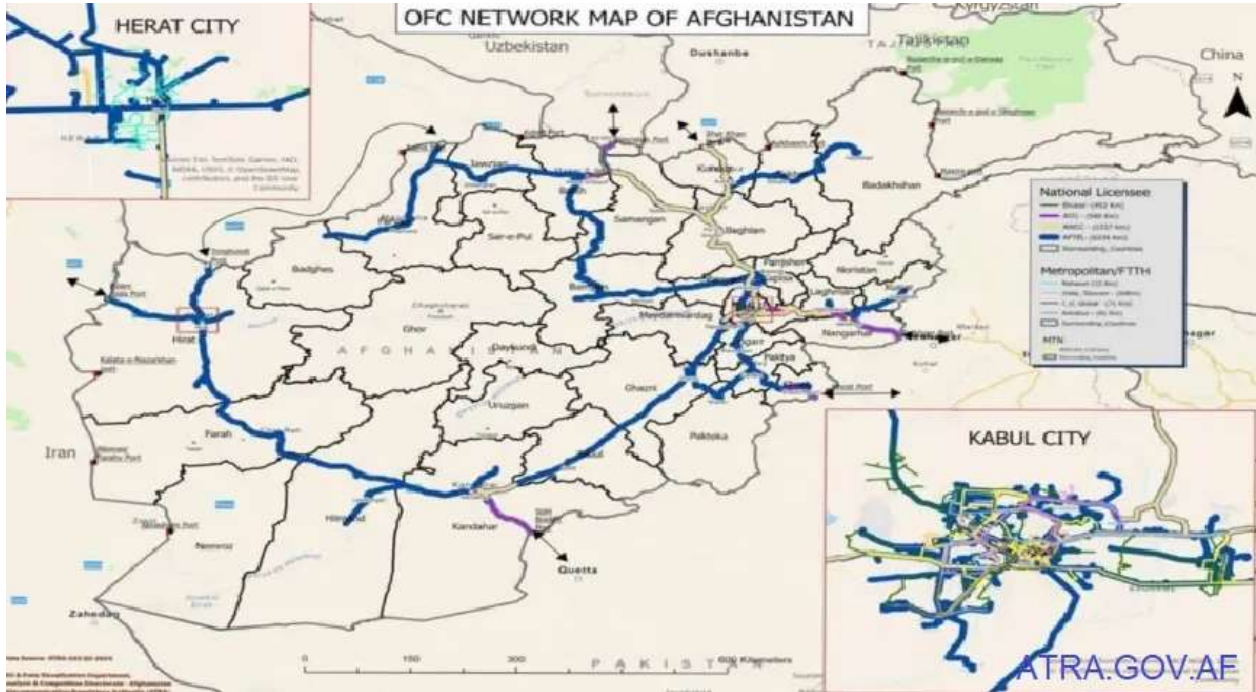
د افغانستان د نوري فايبر شبکه

بهرني خبريالان چې له افغانستانه د راپور جوړولو اراده لري، بايد مخکې له مخکې خپله غوښتنه د واکمنې ادارې بهرنيو چارو وزارت ته وسپاري او څرگنده کړي چې د کومې موضوع په اړه راپور جوړوي. يوه سيمه ييز خبريال چې له يو شمېر بهرنيو خبريالانو سره يې کار کړی، ويلي چې که د راپور موضوع د طالبانو د حکومت د خوښې موضوع، لکه «د امنيت ښه والي» يا «د ښارونو او لارو د رغونې» په تړاو وي نو اجازه ورکول کېږي، خو که موضوع ورته د منلو نه وي، مياشتني مياشتني يې غوښتنې بې ځوابه پاتې کېږي او ورته ويل کېږي چې غوښتنه تر څېړنې لاندې ده.