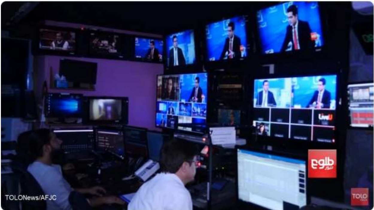
د طلوع نیوز سټوډیو، کابل، ۱۳۹۹ د چنگاښ ۲۸مه