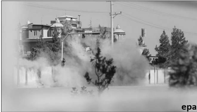
پر شمشاد تلویزون مرکونی وسله وال برید، کابل (۱۶ عقرب ۱۳۹۶)

- د دفتر په نقلیه وسایلو یا دروازه پورې د مقناطیسي ماین نښلول؛ - پر دفتر یا د دفتر پر ودانۍ باندي د هاوان، راکت یا لاسي بم