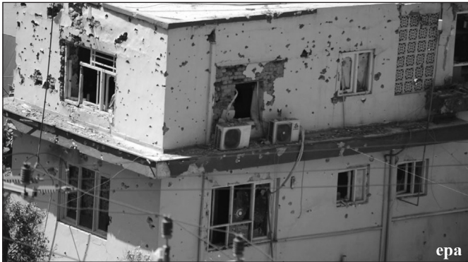
په جلال اباد کې د ملي راډيو ټلويزون پر ودانۍ مرکونې بريد چې په دې پېښه کې څلور کارکوونکي ووژل شول. (۲۷ نور ۱۳۹۶)

د رسنيو مديريت د ارزيايي او څېړنې په اساس ترسره کېږي چې په وسيله يې لازم تدابير نيسي.